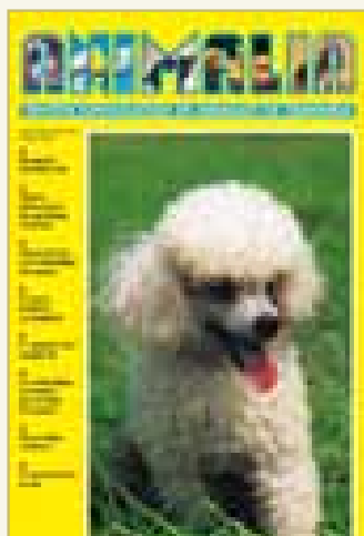
Número 186 - Mayo 2006