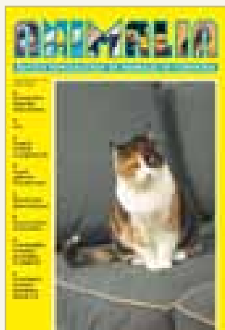
Número 187 - Junio 2006