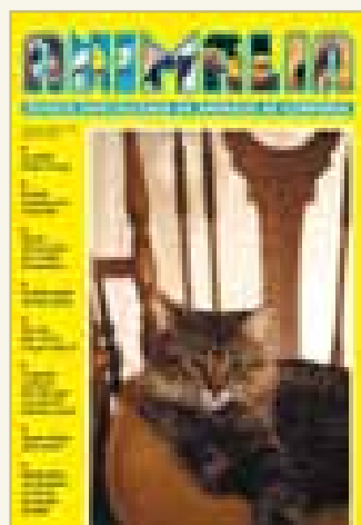
Número 184 - Marzo 2006