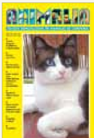
Número 188 - Julio/Agosto 2006