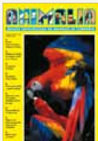
Número 182 - Enero 2006