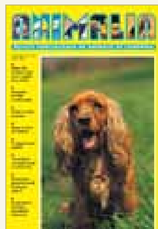
Número 185 - Abril 2006