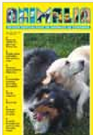
Número 190 - Octubre 2006