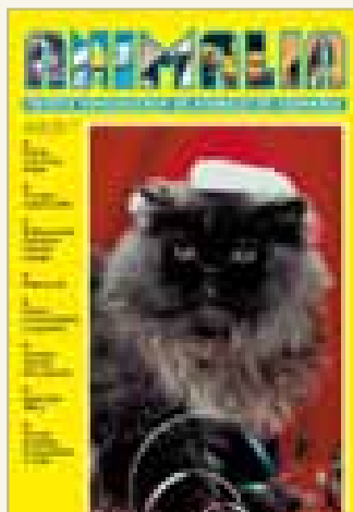
Número 192 - Diciembre 2006