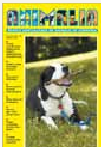
Número 183 - Febrero 2006